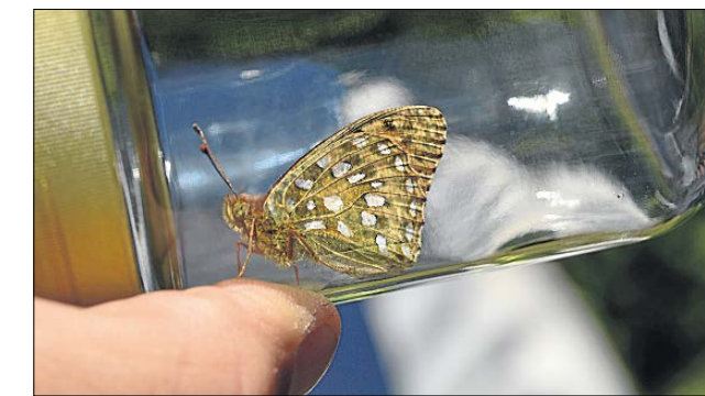
Markperlemorsommerfugl, som denne, der i sommer blev fanget og sluppet fri igen i Klovbakker på Nordmors, er en af de sjældne og truede arter, der er registreret på Mors. Arkivfoto

Firmaet opstod i Søborg i 1988 og har en lang række både danske og udenlandske kunder inden for miljøteknik, vandforsyning, medicinalindustrien samt fødevarer.